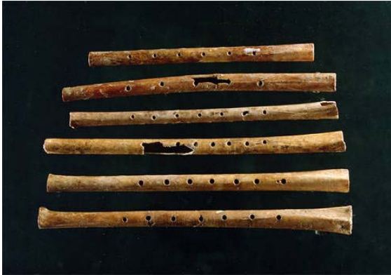
42000 eKr. / Mammutin

Se on tietämys ja kyky, jota tarvitaan ihmisten tarpeita vastaavien aputyökalujen ja -työkalujen valmistamiseen.